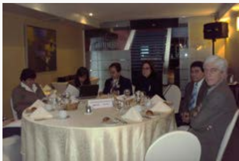
Comité Consultivo Plan Especial de Licenciatura