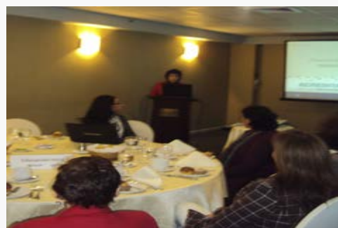
Presentación del proceso de autoevaluación con fines de acreditación

En el siguiente número se informará acerca de: