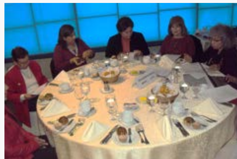
Comité Consultivo de Educación Primaria