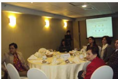
Comité Consultivo de Educación Inicial