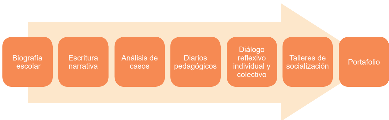
Figura N°1. Estrategias y recursos orientados a favorecer el diálogo reflexivo

La apariencia sigue el ejemplo presentado a continuación: