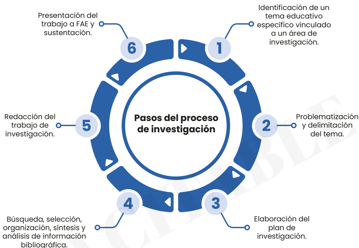
Pasos del proceso de investigación

Nota: Tomado de Valle, Rivero y Bustamante (2021)